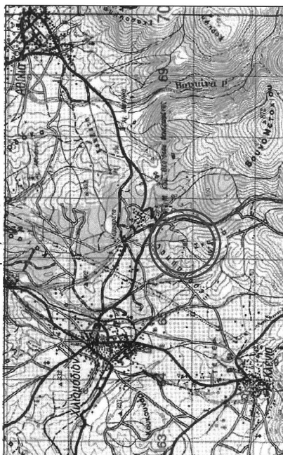
Φύλλο Χάρτη Γ.Υ.Σ. "ΚΟΡΙΝΘΟΣ" Κλίμ. 1/50.000

ΕΘΝΙΚΟ ΤΥΠΟΓΡΑΦΕΙΟ Για τεχνικούς λόγους στο σχεδιάγραμμα, από το ηλεκτρονικό αρχείο, έγινε σμίκρυνση κατά ποσοστό 58%