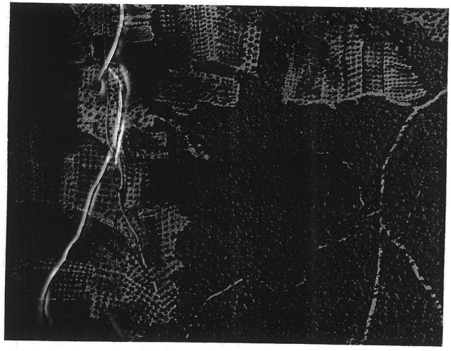
ΑΠΟΣΠΑΣΜΑ ΕΚ ΤΟΥ 04021835 ΟΡΘΟΦΩΤΟΧΑΡΤΗ (Φωτογραμμετρικό υπόβαθρο από ορθοαναγωγή α/φ έτους 2015) ΚΛΙΜΑΚΑ 1:5.000

ΕΘΝΙΚΟ ΤΥΠΟΓΡΑΦΕΙΟ Για τεχνικούς λόγους στο σχεδιάγραμμα, από το ηλεκτρονικό αρχείο, έγινε σμίκρυνση κατά ποσοστό 60%