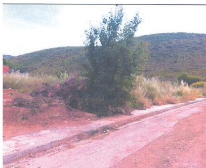
ΑΝΑΤΟΛΙΚΗ ΟΨΗ ΟΙΚΟΠΕΔΟΥ