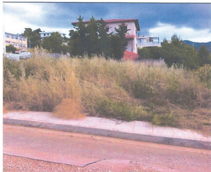
ΝΟΤΙΑ ΟΨΗ ΟΙΚΟΠΕΔΟΥ