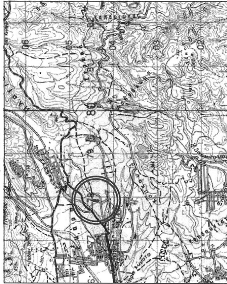
Φ.Χ. ΓΥΣ "ΣΟΦΙΚΟ", κλίμ. 1/50.000